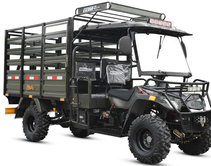
GDM - VERDE