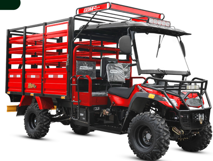
GDM - ROJO