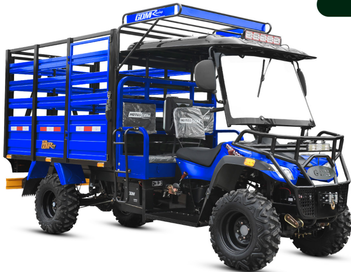
GDM - AZUL