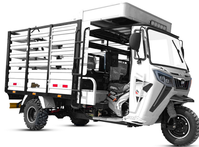
GDM - BLANCO