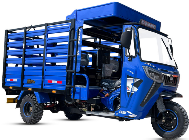
GDM - AZUL