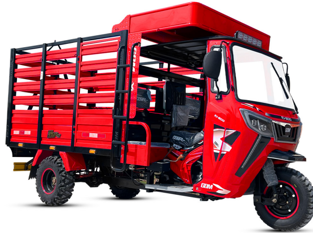
GDM - ROJO